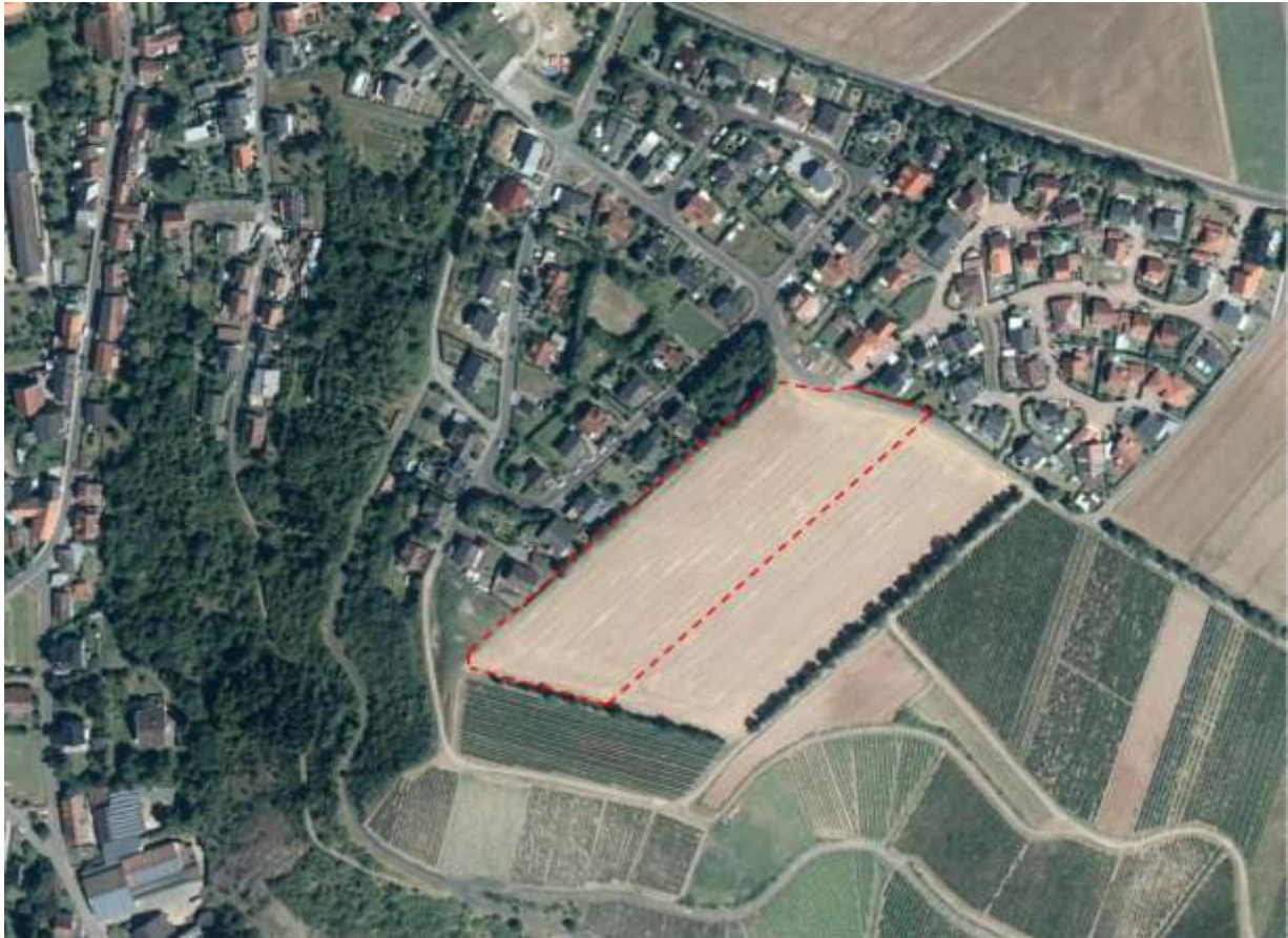
Abbildung 3: Geltungsbereich des Bebauungsplans „Auf der Ley“ mit Luftbild

Nachfolgend ist die Gebietsabgrenzung als Überlagerung mit der Luftbildaufnahme abgebildet. Der Gesamtgeltungsbereich umfasst eine Größe von ca. 1,58 ha.