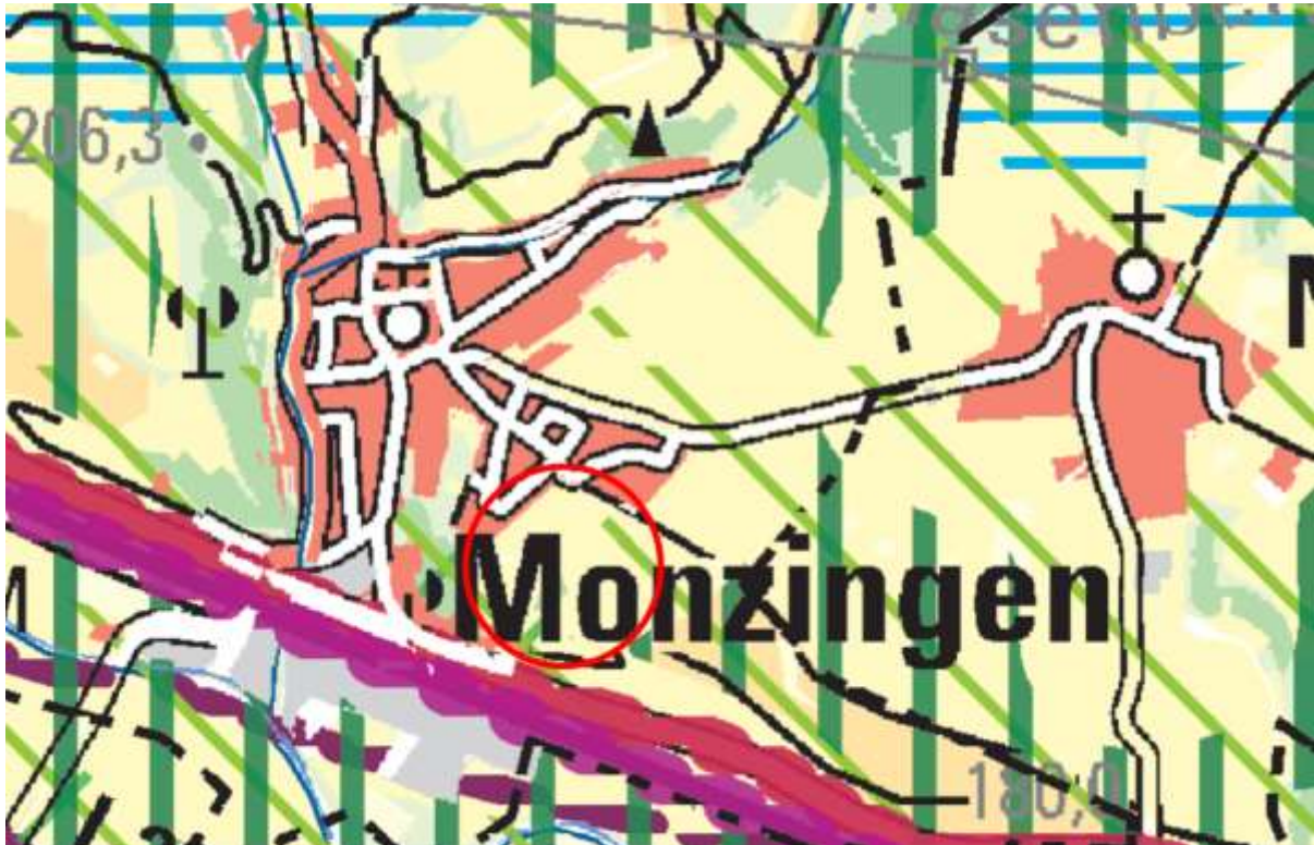
Abbildung 1: Auszug aus dem ROP Rheinhessen-Nahe (2014), Bereich Monzingen „Auf der Ley“ gekennzeichnet

Im Regionalen Raumordnungsplan Rheinhessen-Nahe wird der Gemeinde Monzingen keine besondere Funktion zugeordnet. Aufgrund dessen sind keine hervorgehenden Konflikte aus übergeordneten Planungsebenen zu erwarten.