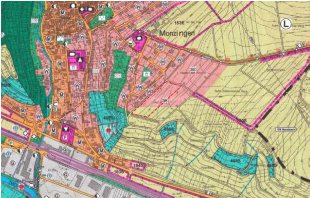
Abbildung 2: Auszug Flächennutzungsplan der ehemaligen VG Bad Sobernheim, Planbereich gekennzeichnet

Für die Ortsgemeinde Monzingen gilt der rechtskräftige Flächennutzungsplan der ehemaligen Verbandsgemeinde Bad Sobernheim, heutige Verbandsgemeinde Nahe-Glan. Der Bereich des Plangebietes „Auf der Ley“ liegt überwiegend als Wohnbaufläche ausgewiesen aber auch für Flächen für die Landwirtschaft. Da die Aufstellung des Bebauungsplanes gemäß § 13 b BauGB erfolgt, kann der Flächennutzungsplan im Rahmen der Berichtigung zu einem späteren Zeitpunkt angepasst werden. Dennoch sind die Voraussetzungen des Entwicklungsgebotes gemäß § 8 Abs. 2 BauGB erfüllt.